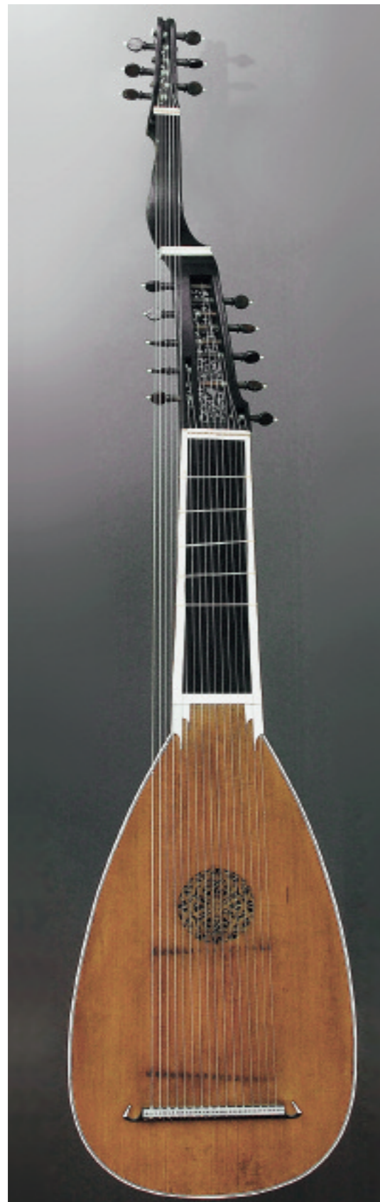
Abb. 139a, b Angélique TieWV 139