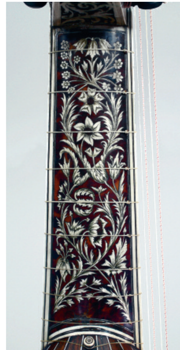
Abb. 143a, b Laute TieWV 142: Hals und Kragen

Hals/Kragen: Rückseite furniert mit Ebenholz und dazwischen acht Elfenbeinstreifen (diese in Verlängerung der Fugen im Rücken). – Unterer Kragen mit angesetztem Chanterelle-Kästchen und ausgestochenem Wirbelkästchen in bassseitiger Wandung. Anzahl der Wirbel derzeit: an der Diskantseite ein Chanterelle-Wirbel und sechs weitere Wirbel, an der Bassseite vier in der ausgestochenen Wandung sowie drei weitere. Ursprünglich an der Diskantseite ein Wirbel für die Chanterelle und vier weitere, an der Bassseite zwei im ausgestochenen Kästchen sowie drei weitere. Am oberen Abschluss vom unteren Kragen auf allen vier Seiten profilierte Leistchen aus Elfenbein. Rückseitig ausgesägtes Ornament aus Elfenbein mit Blatttranke (Ranke Typ F, vgl.