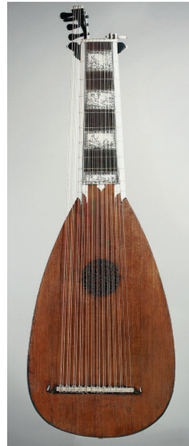
Abb. 141 Laute TieWV 142

Decke: Fichte ( Picea abies ). – Zweiteilig. Elfenbeinkante. Rosette mit Flechtmuster.