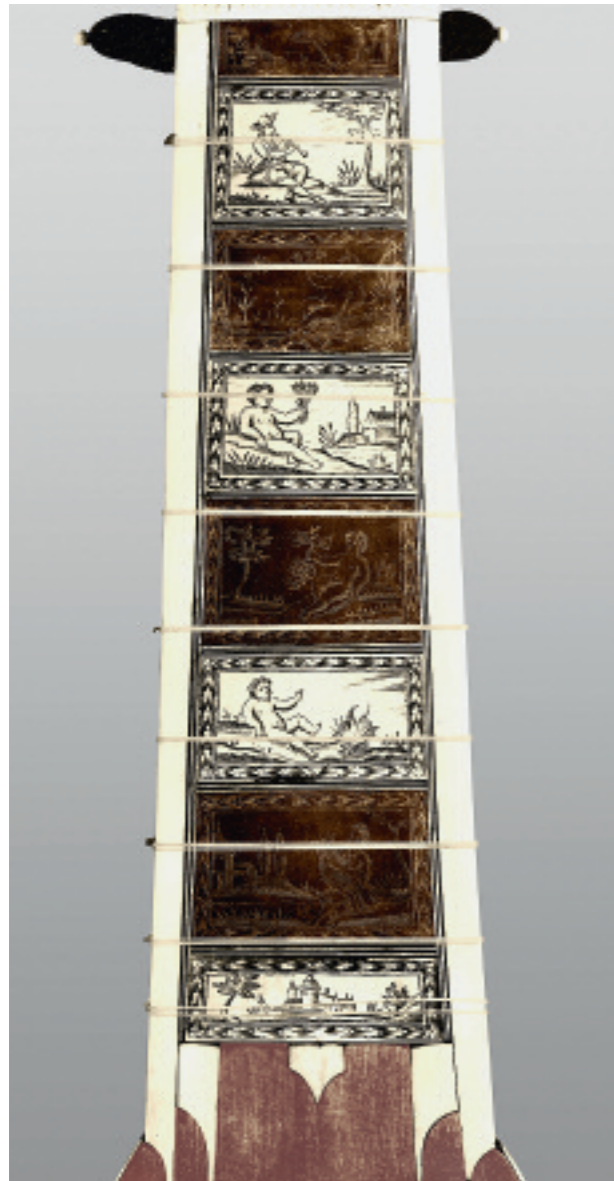
Abb. 142 Laute TieWV 142: Griffbrett

Rücken: neun Späne Palisander mit Elfenbeinadern dazwischen. Hals/Kragen: Hals mit Marketerie aus Elfenbein in Schildpatt: zwei von unten aufsteigende, einander mehrfach kreuzende Ranken (Ranke Typ D, vgl. Abb. 37d); dreispännige Einlageadern und Elfenbeinstreifen als Umrahmung. – Kragen fast rechtwinklig abgeknickt; rückseitig in Elfenbein à jour gearbeitete Ranke (wahrscheinlich n.o.). Reiter für die Chanterelle aus Elfenbein; Bassreiter nachträglich hinzugefügt.