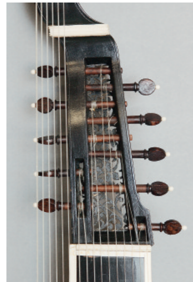
Abb. 140 Angélique TieWV 139: für Tielke charakteristische Konstruktion des unteren Kragens

Die folgenden Angaben nach GH 1980, vom Kunsthistorischen Museum Wien, nach älteren eigenen Fotos, aus dem Katalog des Auktionshauses Christie's London sowie von Jonathan Bouquet, Vermillion/SD.