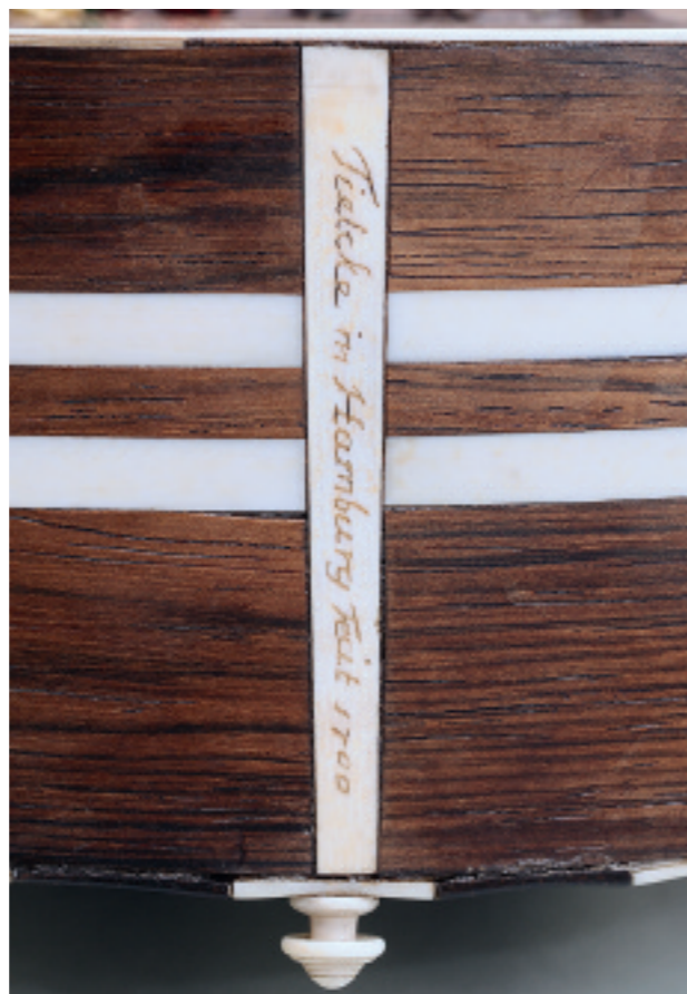
Abb. 205 Terzgitarre TieWV 111: Signatur an den Zargen unten

rückseitig mit Marketerie aus Elfenbein in (hell unterlegtem) Schildpatt; von unten aufsteigende Ranke Typ D (vgl. Abb. 37d); zusätzlich auf dem Schildpattgrund in Gravur zahlreiche zierliche »Samenfädchen«; beidseitig dreispännige Ader Elfenbein/Ebenholz/Elfenbein und zwei Streifen Schildpatt und Elfenbein. Sägeschnitte mit rotem Kitt, gravierte Binnenzeichnung mit grünem Kitt gefüllt. – Wirbelbrett: Ahorn, rahmenartig, mit vielfach geschwungenem Umriss; Rahmenleisten auf Vorder- und Rückseite innen mit hell unterlegtem Schildpatt, nach außen hin mit Elfenbein belegt; à jour gearbeitete Elfenbeinplatte mit Ranke Typ F (Rundblättchenranke, vgl. Abb. 83).