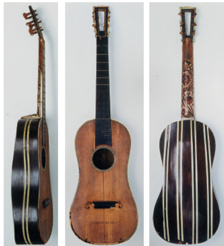
Abb. 207a–c Gitarre TieWV 118

Signatur: gedruckter Zettel, kleines Format: »IOACHIM TIELKE || in Hamburg, An. 16[hs., dabei die 6 überschrieben?]701«. – Auf dem Zapfen graviert: »Tielke || Hamburg«.