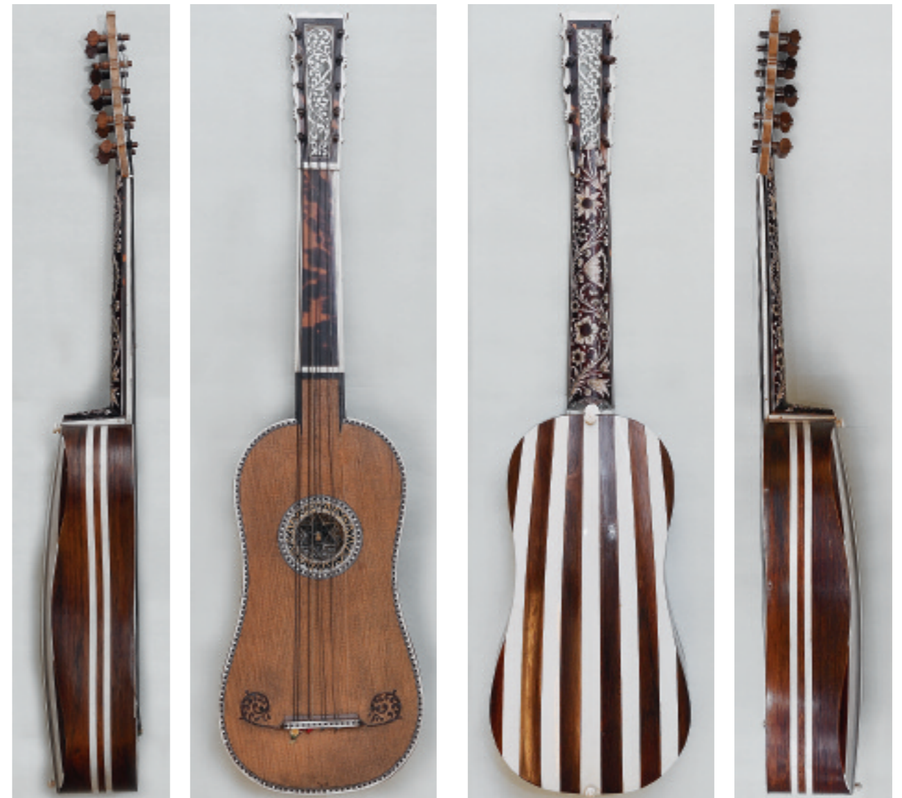
Abb. 203a–d Terzgitarrre TieWV 111