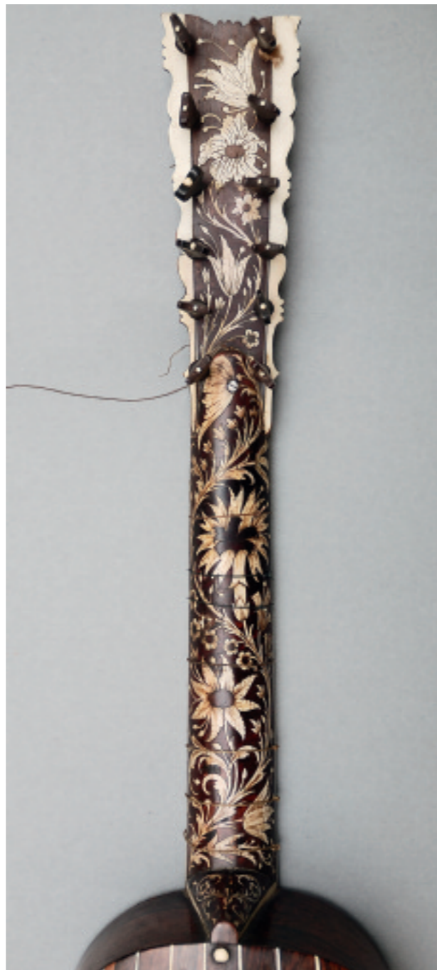
Abb. 202 Gitarre TieWV 101: Hals und Wirbelbrett

Maße: Gesamt-L: 91; Korpus-L: 42,8; Decken-B oben/Mitte/unten: 19,1/16,1/23,5; Zargen-H am Halsfuß/in der Mitte/unten: 7,5/8,6/8,7; Boden-B: 20,2/17,3/25,2; Hals-M: 25,6.