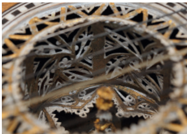
Abb. 204 Terzgitarre TieWV 111: Rosette